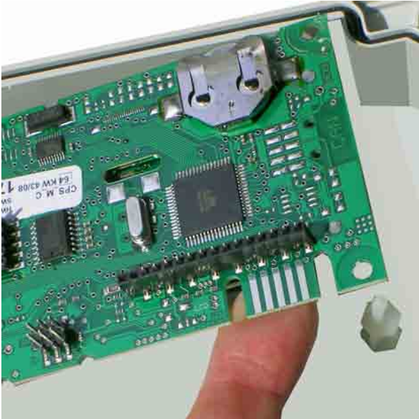
Anheben der Platine aus den Rastnasen