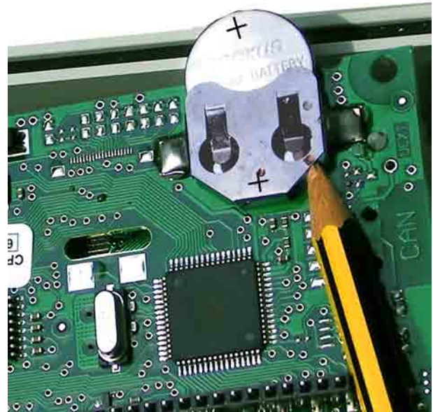
Entnehmen der Batterie